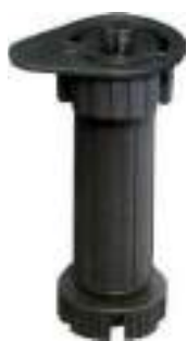
Pata con base estandar Espiga Ø13