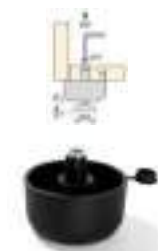
Pata Sandy mini