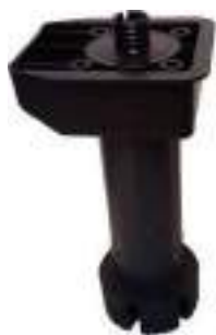
Pata con base cuadrada Espiga Ø13.