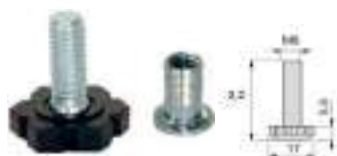
Nivelador + tuerca