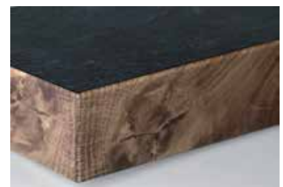
Canto PVC nudos